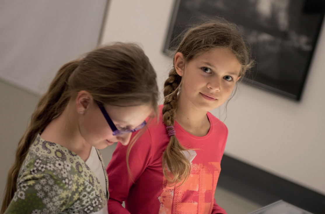
Layout und Fotos: Ulf Cronenberg

eVOCATION -Weiterbildungen werden von erfahrenen Referentinnen und Referenten aus Deutschland, Österreich und der Schweiz durchgeführt, die seit Jahren an Schulen und Hochschulen mit dem Schwerpunkt Begabungsförderung arbeiten. Alle Kurse sind praxisorientiert angelegt. In die grundlegende eVOCATION -Weiterbildung, die über die PH Karlsruhe zertifiziert werden kann, sind Hospitationen an Schulen in Berlin, Wien und Würzburg integriert.